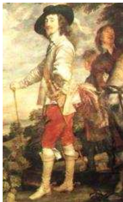
Anglický kráľ Karol I. (1600 – 1649) Van Dyck, Paríž, Louvre

Táto karikatúra roľníka nesúceho ťaženie a predstaviteľa duchovenstva naráža na daňové zaťaženie ľudu. Privilegované stavy poberajú dôchodky, ktoré získavajú z prostriedkov nižších vrstiev (v tomto prípade symbolizované roľníkom)