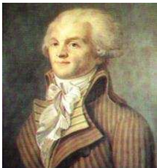
Robespierre (1578 – 1794) Paríž, múzeum Carnavalet