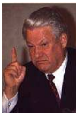
Jelcin - vlasatý