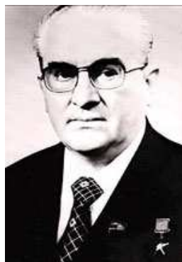
Andropov - plešatý