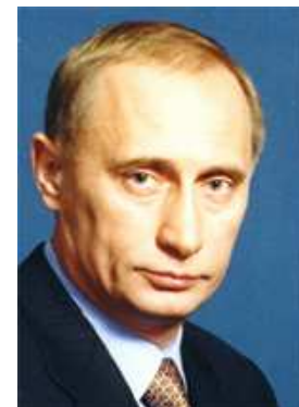
Putin - plešatý