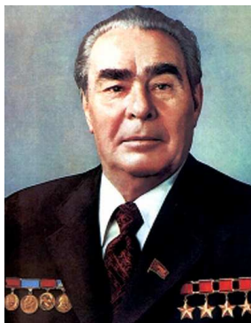
Brežnev - vlasatý