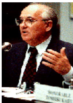
Gorbačov - plešatý