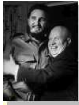
Chruščov - plešatý