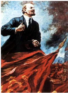
Lenin - plešatý