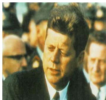
Prezident USA J.F.Kennedy sa prihovára ľudu

Karibská / kubánska raketová kríza 1962 : v 1961 odsúhlasil prezident USA J. F. Kennedy (nástup do prezident. úradu – 1961) akciu CIA na zvrhnutie Castrovho režimu na Kube. V zátoké svíř sa vylodili proticastrovské vojská, ktoré boli na hlavu porazené. ZSSR sa snažil využiť situáciu a pod zámienkou ochrany bezpečnosti Kuby inštaloval v lete 1962 na Kube svoje jadrové rakety . Operácia prebiehala v úplnej tajnosti. V polovici októbra 1962 však americké prieskumné lietadlo U-2 odfotovalo rozmiestnenie jadrových rámp na Kube. USA cítili sa blízkosťou sovietskych rakiet ohrozené, vyhlásili 22.10. 1962 námornú blokádu (karanténu) Kuby , žiadali okamžité odstránenie rakiet z Kuby a uviedlo do pohotovosti všetky svoje vojenské sily na celom svete. Chruščov síce najprv existenciu sovietskych rakiet na Kube poprel, nakoniec však ustúpil a súhlasil s americkou požiadavkou pod podmienkou, že aj USA stiahnu svoje rakety Jupiter z Turecka a zaviazu sa, že nenapadnú Kubu. 28.10.1962 začal ZSSR svoje rakety demontovať . O necelý mesiac odvolali USA námornú blokádu Kuby. Počas karibskej krízy sa svet ocitol na pokraji tretej svetovej vojny.