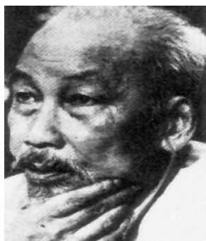
Ho Či Min