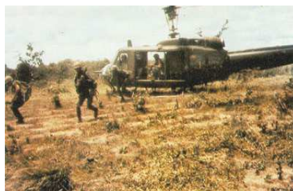
Američania v akcii