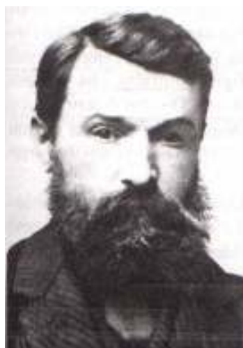
Svetozár Hurban Vajanský