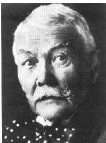
Pavol Országh Hviezdoslav

Spomínaní autori veľmi dobre poznali problematiku zemianstva, hoci každý z nich ju rieši svojším spôsobom. Súvisí to s obdobím, v ktorom diela vznikli a s umeleckými metódami, ktoré používali jednotliví autori.