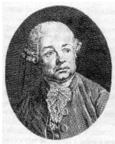
Adam František Kollár