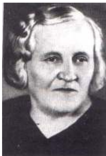
Božena Slančíková Timrava