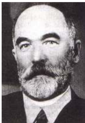
Jozef Gregor Tajovský